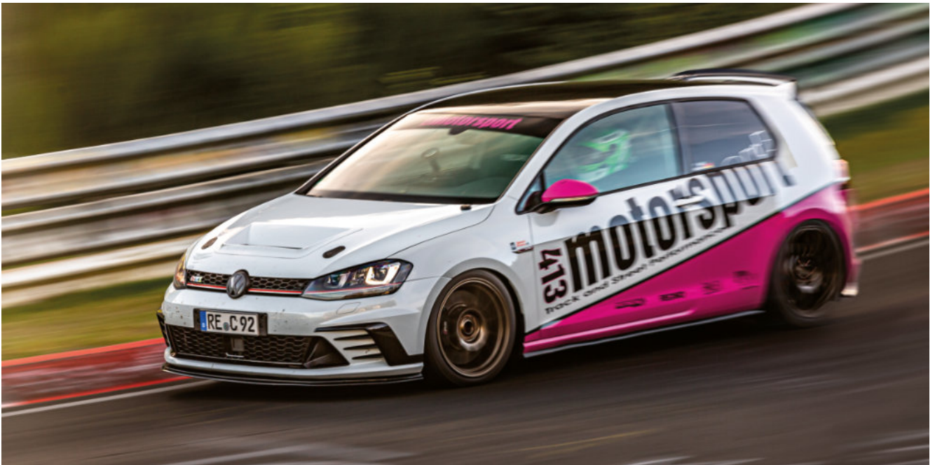
Bild 2: Auch die Duisburger Jungs von 413 Motorsport setzen auf die leichten und stabilen Räder aus dem Hause PROTRACK - unter anderem da oftmals eine Straßenzulassung für die gebauten Tracktools Pflicht ist.